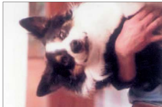
Tim hilft Herrchen.

Die „Hasseröder Jungs“ aus der TV- und Printwerbung sind einem mittlerweile vertraut und fast ein wenig ans Herz gewachsen. Ihr Fußballspiel mit der Seife im Duschaum, der Torwart, der seine Bierflasche in die Hand gelegt bekommt, weil er ja nichts fängt, das verregnete Gartenfest, all das sind Szenen, die man kennt und trotzdem gerne wieder sieht.