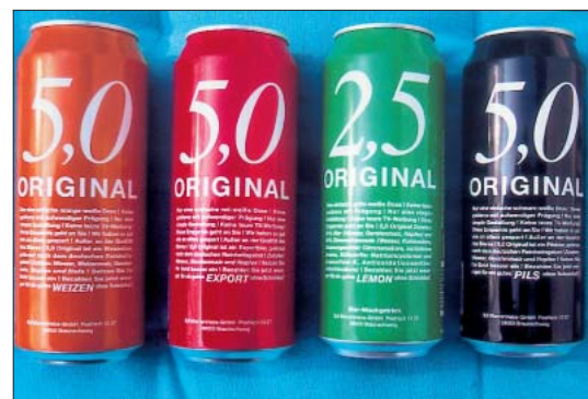
Die Antwort auf Original Oettinger.

Das wäre nicht weiter aufregend, wenn da nicht einige Elemente sehr außergewöhnlich sind. Das muss per se keine Kritik hervorrufen.