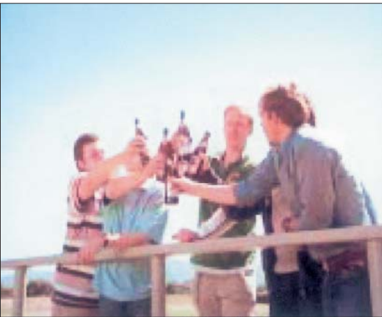
Männer sind so!

sich die Brauerei, außer eventuell zu hohen Gagenforderungen der Vorguppe, etwas dabei gedacht.